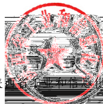
陕西省工业和信 息化厅