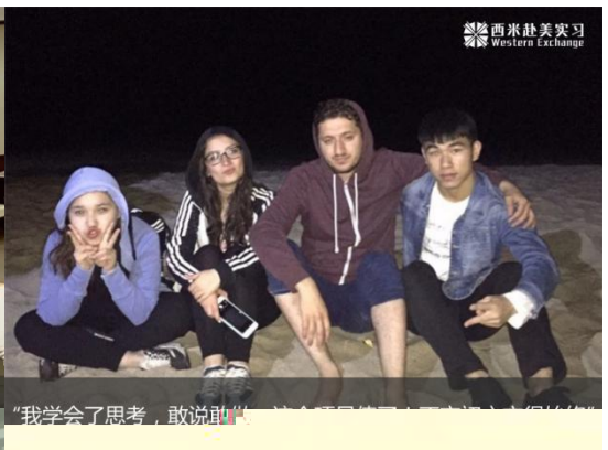
“我学会了思考，敢说敢做”