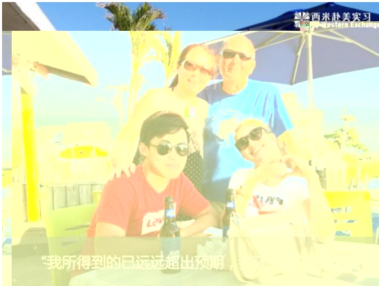
“我所得到的已远远超出预期”