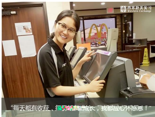
“每天都有收获，每天都在成长，我都应心怀感恩！”