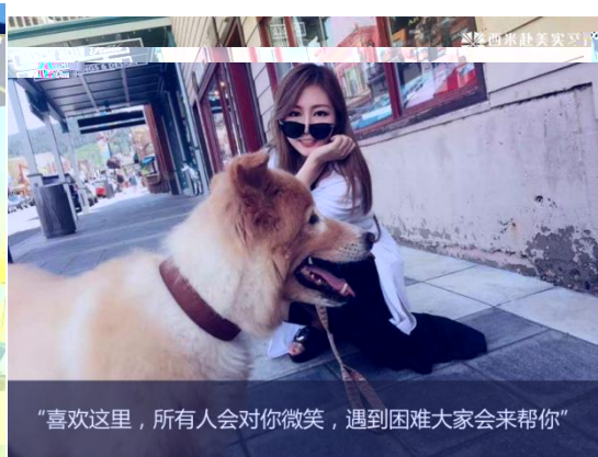
“喜欢这里，所有人会对你微笑，遇到困难大家会来帮你”