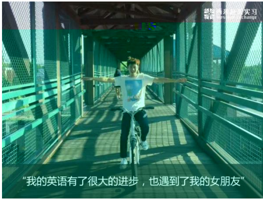
“我的英语有了很大的进步，也遇到了我的女朋友”