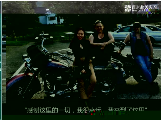
“感谢这里的一切，我很幸运，我来到了这里”