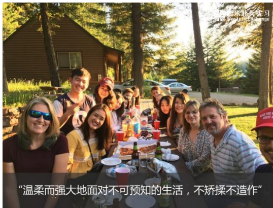
“温柔而强大地面对不可预知的生活，不矫揉不造作”